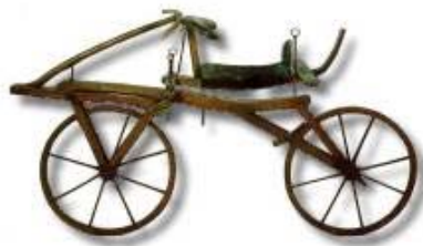
生平 - 肖像重画

德莱斯的父亲升迁为高级宫廷法庭的执政主席后全家于 1810 年迁居曼海姆。德莱斯在 1811 年带薪停职之后也移居于此。在这里他让人建成了一台自动键盘打字机 ( 1812 ) 以及两辆四轮人力助动车 ( 1813/14 )，并且将第二辆介绍到维也纳会议之上。他完成了数篇数学论文并最终发明了两轮跑动车 ( 1817 )。