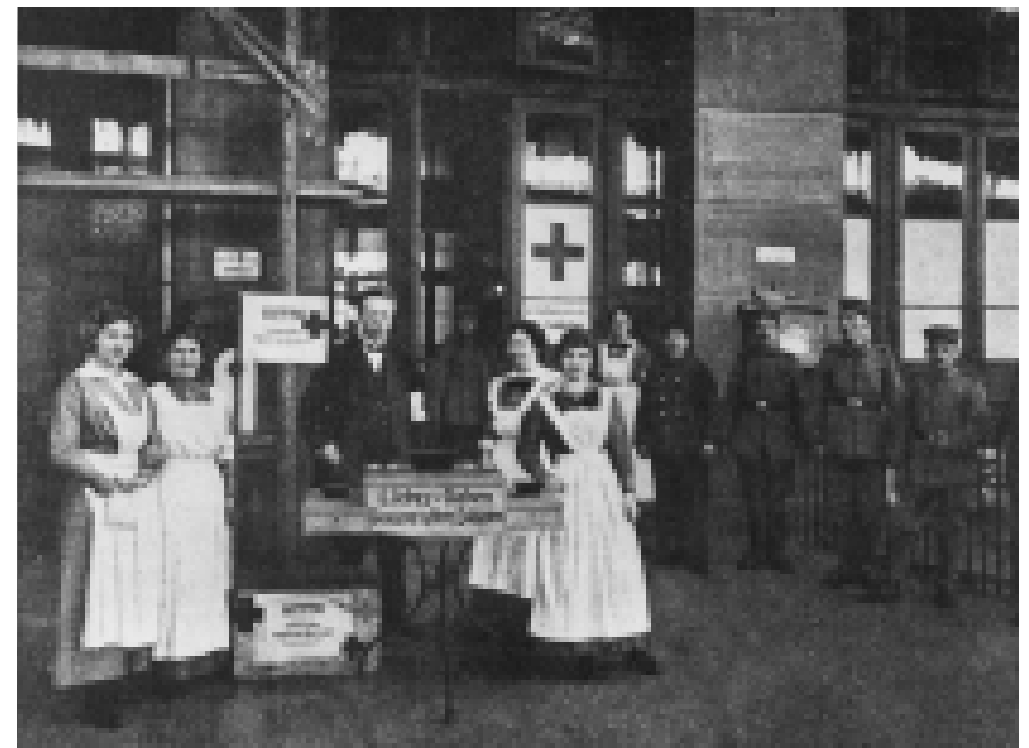
Im 1. Weltkrieg betreibt das Rote Kreuz im Hauptbahnhof eine Erfrischungsstation für durchreisende Soldaten.