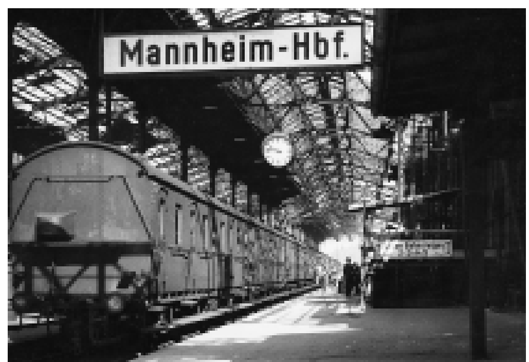
Im 2. Weltkrieg wird der Mannheimer Hauptbahnhof durch Bombenangriffe weitgehend zerstört. Noch 1949 ist die Überdachung der Bahnleiße nicht wieder hergestellt.