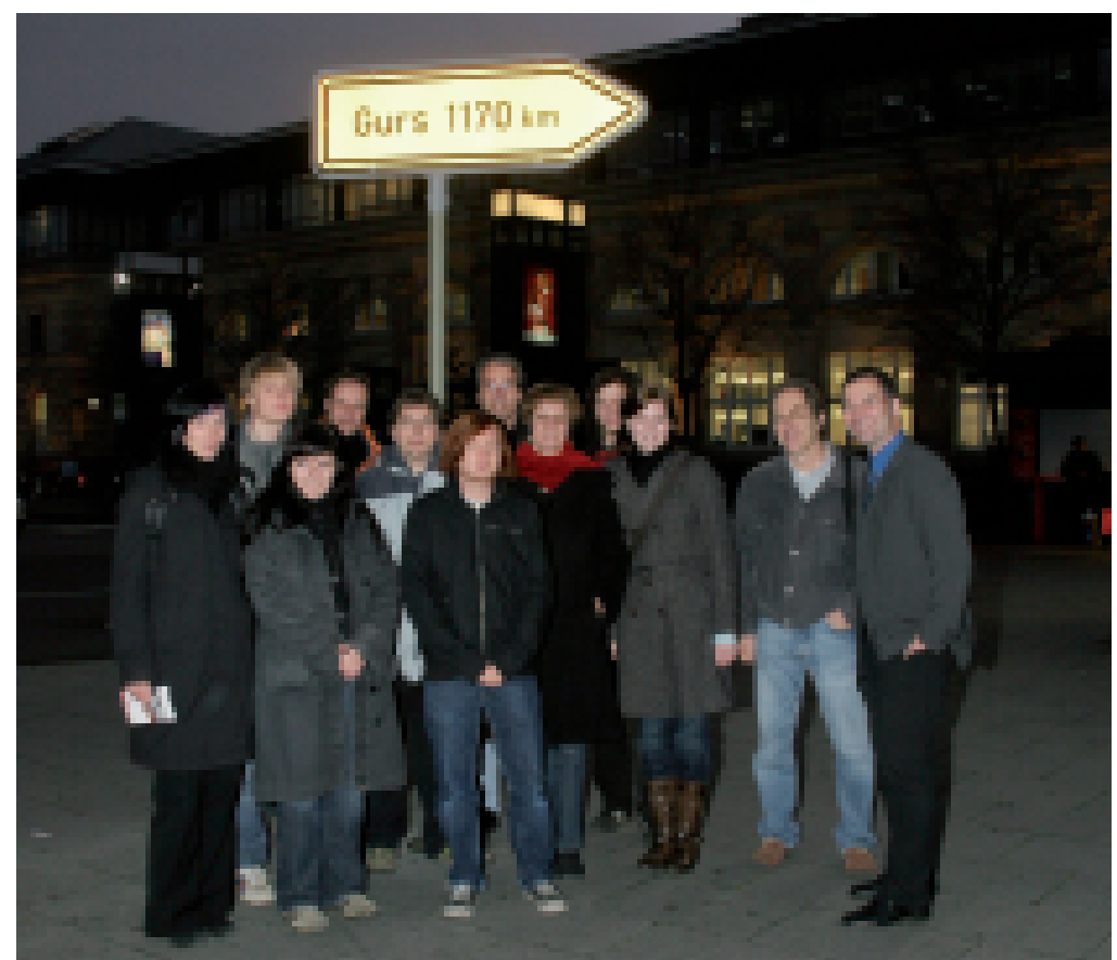
Enthüllung des Hinweisschildes „Gurs 1170 km“ am 29. November 2006. Die Aufstellung des Schildes geht auf die Initiative einer Gruppe von Jugendlichen zurück, die sich 2005/06 in dem Projekt „Souvenir de Gurs“ engagiert mit dem Schicksal der rund 2 000 Mannheimer Juden beschäftigt haben, die am 22. Oktober 1940 mit der Bahn in das Lager Gurs am Rande der Pyrenäen deportiert wurden. Der Hinweis in Form eines modernen Wegweisers soll die Erinnerung in der Gegenwart lebendig halten.